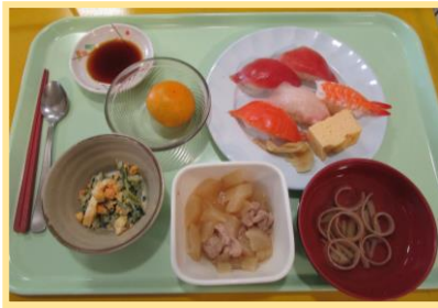
～にぎり寿司 大根と鶏肉の煮物～