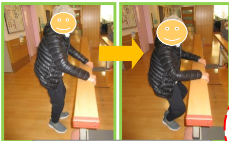
平行棒を使ったスクワット